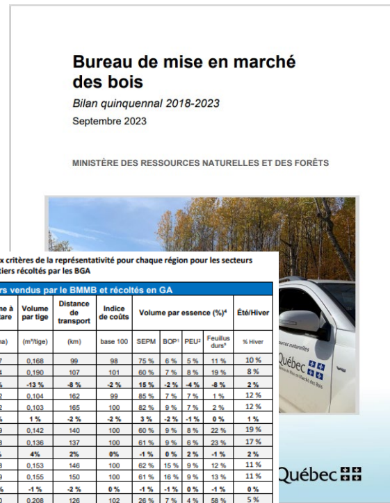
Tableau 6 – Résultats selon les six critères de la représentativité pour chaque région pour les secteurs vendus par le BMMB et les chantiers récoltés par les BGA